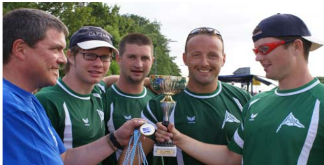
Teamchef Siegerehrung überreicht Pokal an ESV Kupferdreh