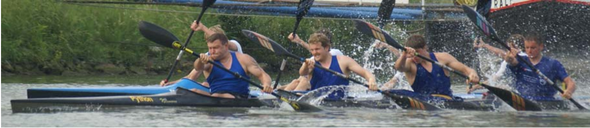
K 4 Herren LK 200 m KEL Datteln