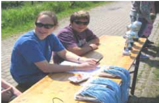
Das Pokal & Medaillen Team