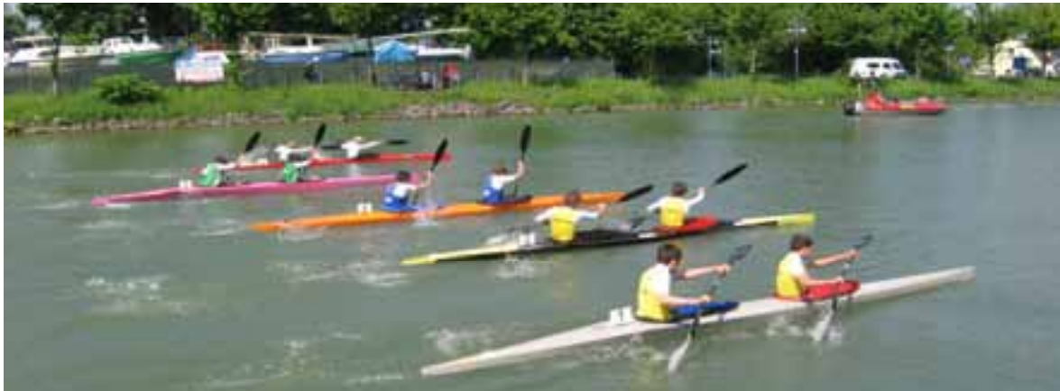
K 2 männliche Jugend 4000 m KEL Datteln