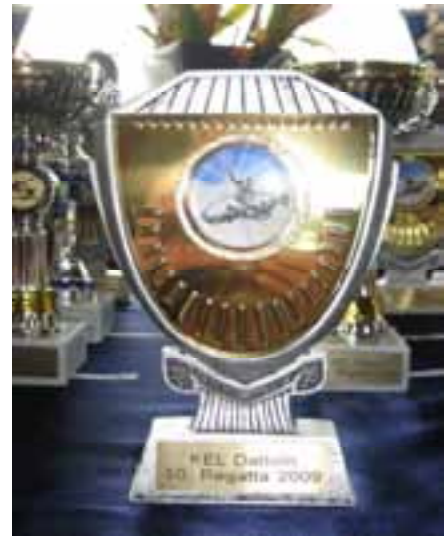
Trophäe Schülerspiele 2009